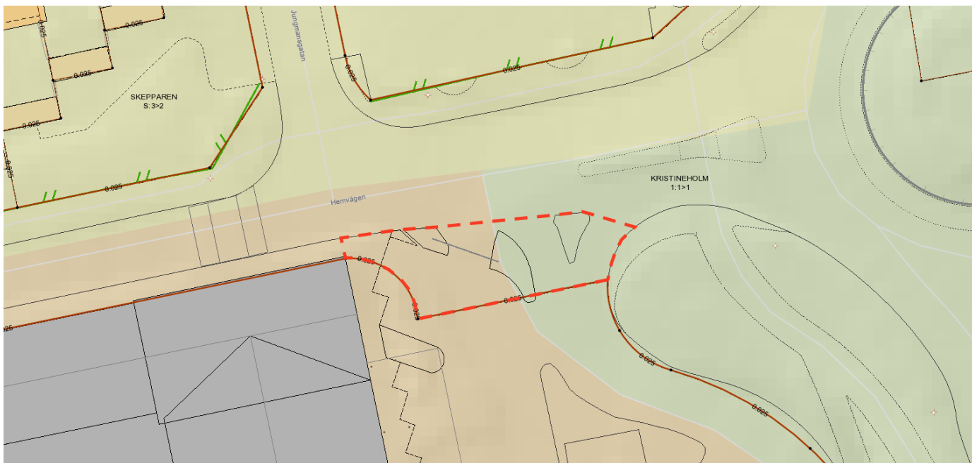
Område för planändring nr 1, fastigheten Kristineholm 1:1, inom röd markering